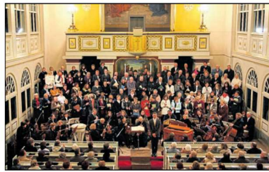
Es singen der Projektchor, der Jugendchor und die Kurrende der Ev.-Luth. Kirchgemeinde.