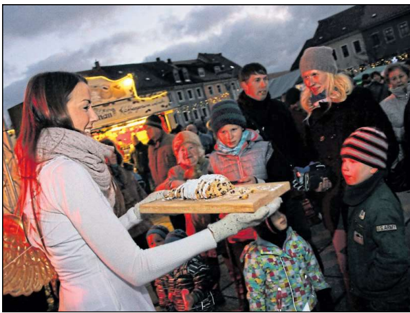
Zu den schönen Traditionen gehört auch die Verteilung des Stollens an die Marktbesucher durch den Weihnachtsengel.