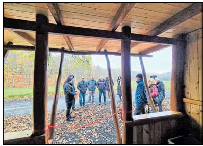
Bei diesem Wetter hielten es die Teilnehmer nicht lange vor der Hütte aus.