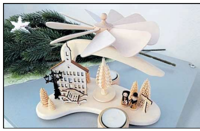
Eine absolute Neuheit ist dagegen eine Pyramide mit Bischofswerdaer Stadtsilhouette.

Fortsetzung von Seite 1 Um aus der (Energie-)Not eine Tugend zu machen sowie einen Beitrag zur Umsetzung der Energiesparverordnung zu leisten, wurden aber alle Händler des Weihnachtsmarktes gebeten, über alternative Lichtquellen für ihre Stände nachzudenken. Die Stadt Bischofswerda ist sich sicher, dass zum Beispiel das Licht von Kerzen oder Fackeln sowie eine Besinnung auf „alte Zeiten“ das weihnachtliche Flair noch mehr steigern und alle Herzen der Besucher wärmen wird. Offiziell eröffnet wird der Weihnachtsmarkt am Freitag, dem 2. Dezember 2022 , 16 Uhr, durch Oberbürgermeister Holm Große – traditionell mit dem Stollenanschnitt. Das leckere Weihnachtsg Gebäck kommt wieder von der Bäckerei Fehrmann. Die Stücke werden aber nicht kostenlos verteilt. Wie in den Vorjahren wird um eine Spende von 50 Cent gebeten. Falls Stollenliebhaber etwas mehr geben wollen, können sie dies zur Freude des Bischofswerdaer Kostümfundus gern machen – denn diesem und seinem demnächst anstehenden Umzug kommen die kompletten Erlöse des Stollenanschnittes zu. Bereits eine Stunde vorher öffnen rund 20 Händler, Vereine und Institutionen ihre Stände für hungrige, durstige oder geschenkesuchende Besucher. 16.30 Uhr erwartet dann der Weihnachtsmann mit seinen Engeln das erste Mal an den drei Tagen viele Kinder auf der Bühne. An den beiden Wochentagen erscheint der „alte Mann“ bereits 16 Uhr, um im Gegenzug für tolle Gedichte und Lieder kleine Geschenke an die Kinder zu überreichen. Nach