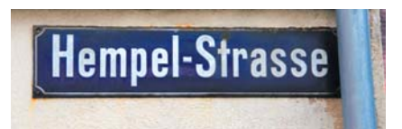
Fabrikgebäude der Bandweberei Hempel im Jahre 1872; Gedenkplatte zur Firmengründung 1767 und Wegesteintafel Nr. 9 des Pulsnitzer Heimatvereins; Ansichten des sog. „Pillnitzer Hauses“ im Jahre 1896 und 2025; Fabrikgebäude in den Jahren vor dem Abriss 1997 in ruinösem Zustand; Straßenschilder mit Bezug zur Fabrikantenfamilie Hempel